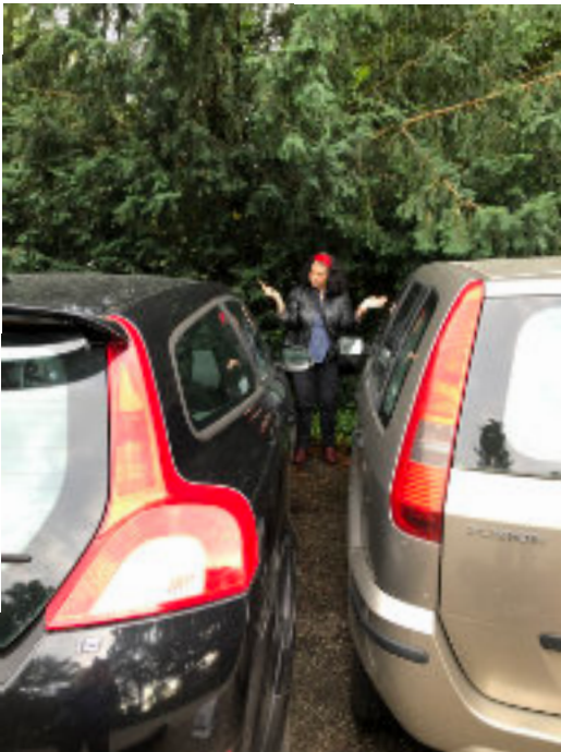
Let bij parkeren op de afstand tussen de auto's Deze dame moest via de passagiersstoel door haar auto klimmen om weg te kunnen.

Op 8 en 21 augustus van 10.30-11.30 uur bij de kantine. Voor vragen, opmerkingen, advies of gewoon even bij praten.