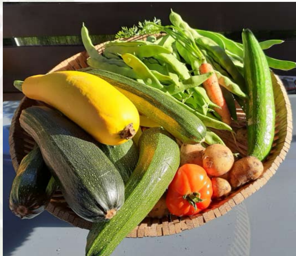
Groenten uit Tuin 58/60 van Tuinpark Lissabon.