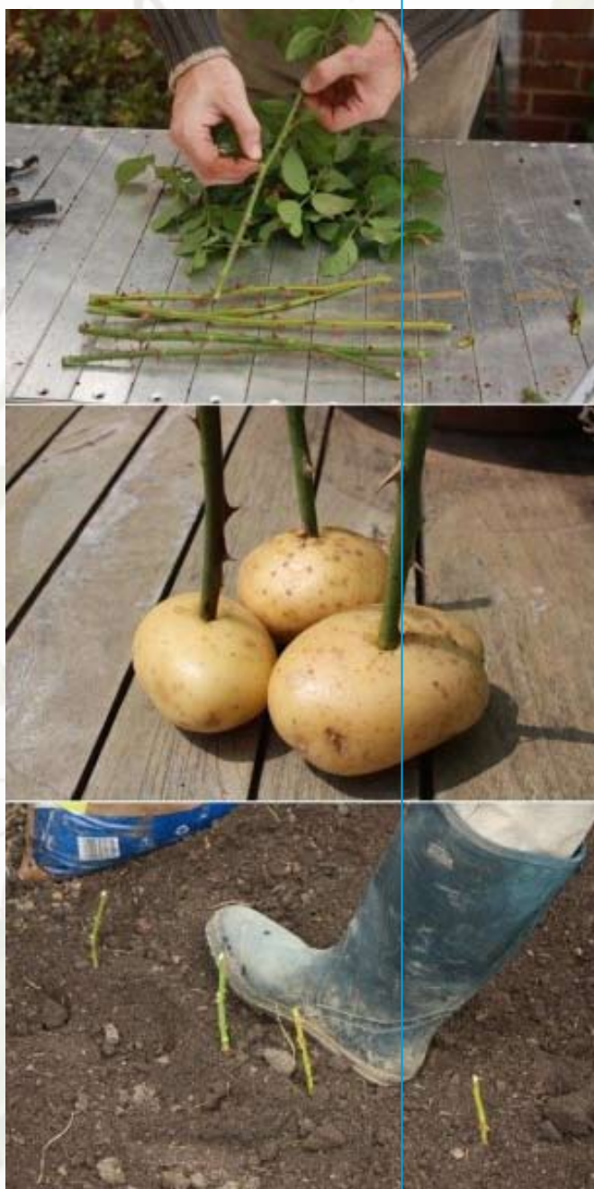
Rozen stekken kan ook zo