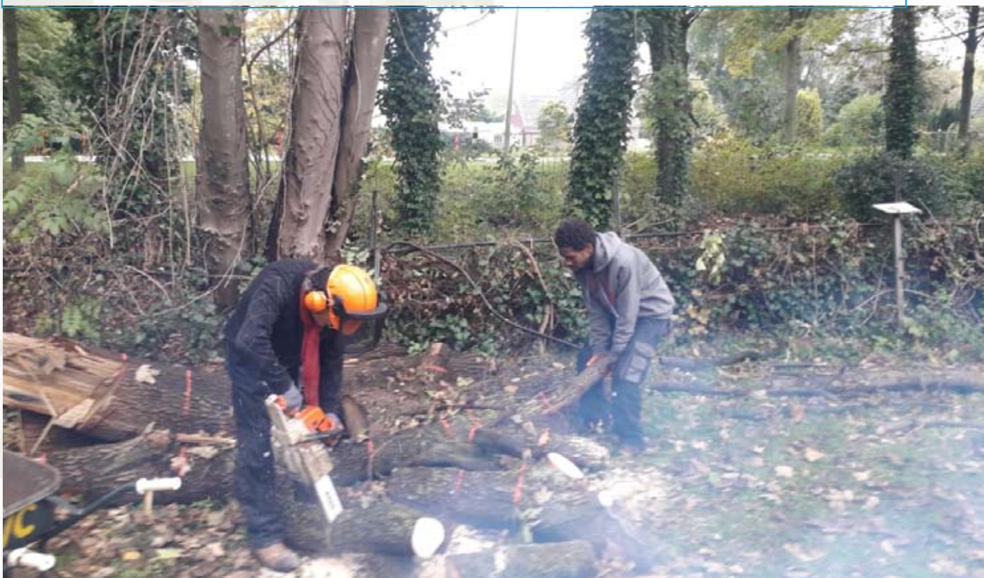
De werkploeg van Creade is sinds eind augustus aan het werk op het tuinpark.