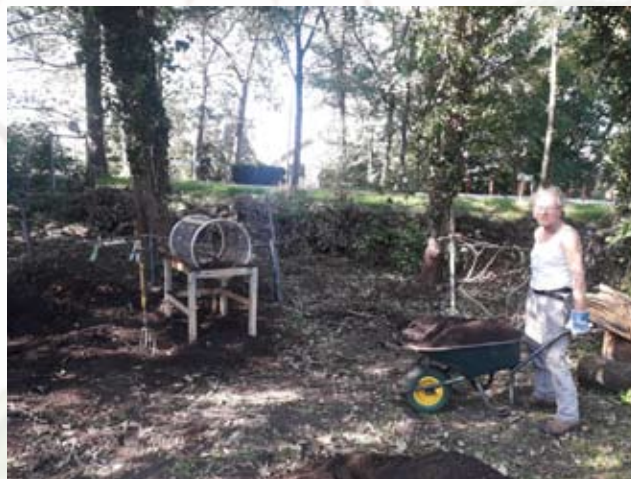
Bezig met het zeven van compost en het zagen van een boom.